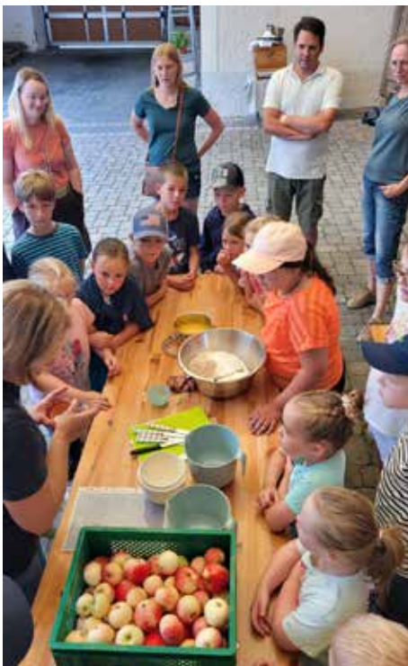
Gemeinsam Apfelkuchen machen