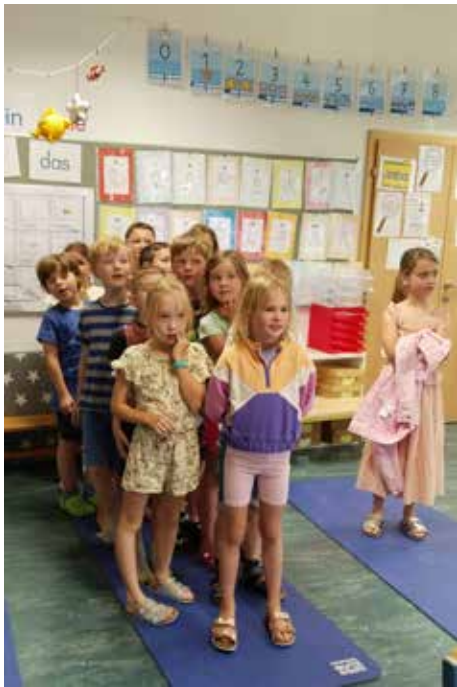
1,2 oder 3 – beim abschließenden Quiz durften die Kinder ihr erlerntes Wissen über den Regenwurm unter Beweis stellen.

einen Workshop zum Thema „Boden“ in der Volksschule Steinhaus. Die Experten erzählten spannende Fakten über den Boden und erklärten, warum der Regenwurm eine so wichtige Rolle einnimmt. Im Anschluss lud die Ortsbauernschaft die Kinder zu einem Mal- und Zeichenwettbewerb ein.