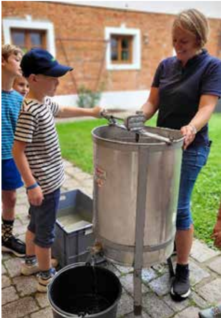
Honig schlendern selbst ausprobieren