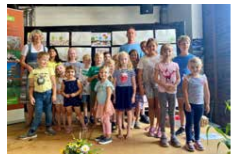
Danke an die Kinder für die vielfältigen Zeichnungen zum Thema „Auf einem gesunden Boden wachsen die besten Lebensmittel!“