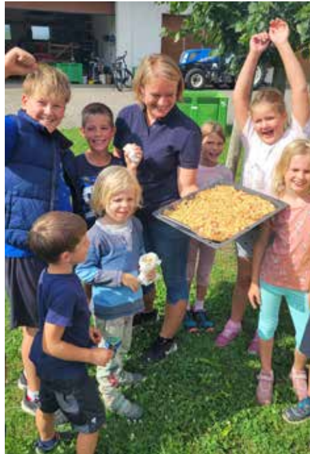
Endlich: Der Apfelkuchen ist fertig!