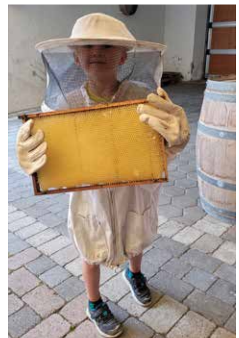
Ein junger Imker mit Bienenwabe