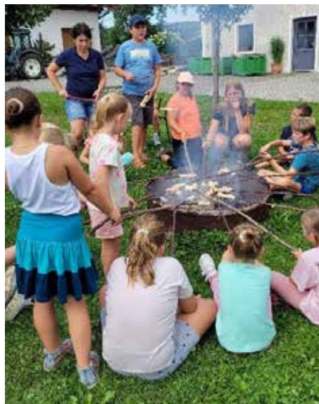
Stockbrot grillen am Lagerfeuer