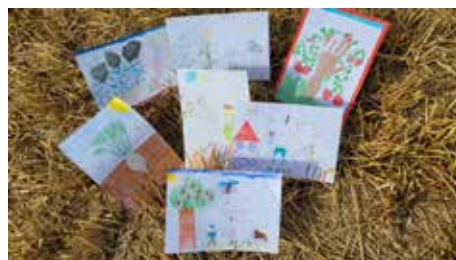
Auch einige Kindergartenkinder beteiligten sich beim Mal- und Zeichenwettbewerb.