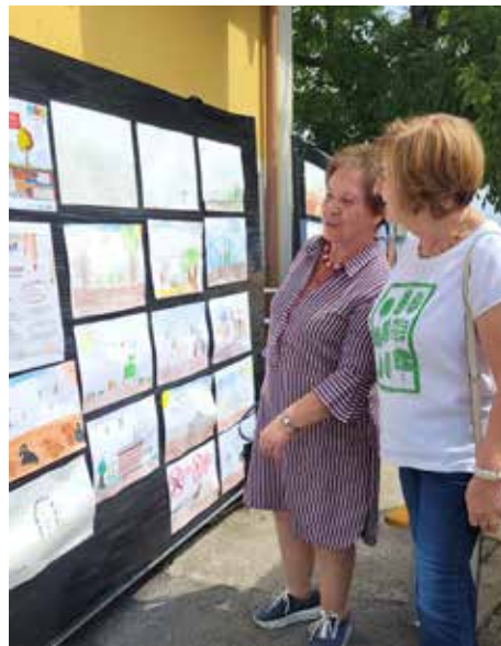
Die Besucher*innen waren beeindruckt von den Zeichnungen der Kinder.

Eine tolle Aktion der Ortsbauernschaft, die die große Bedeutung unseres Bodens und der Landwirtschaft wieder mehr in den Vordergrund rückte!