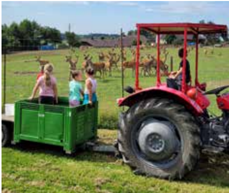
Auch den Hirschen schmecken Äpfel.