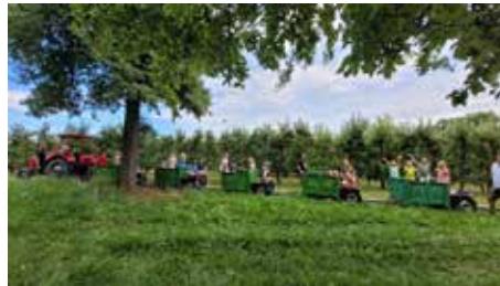
Tour mit dem Apfelzug durch den Apfelgarten