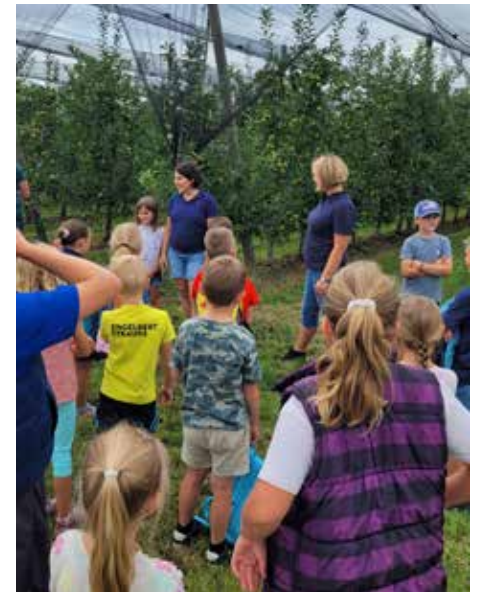
Im Apfelgarten der Fam. Gatterbauer

Bei der Ferienpassaktion am Apfelhof Gatterbauer in Thalheim wurde den Kindern bewusst, wie wichtig Bienen für die Bestäubung der Apfelbäume sind und dass gesunde Böden und eine artenreiche Umgebung entscheidend für die Qualität und den Ertrag der Apfelernte sind. Danke allen Beteiligten für diesen erlebnis- und lehrreichen Nachmittag!